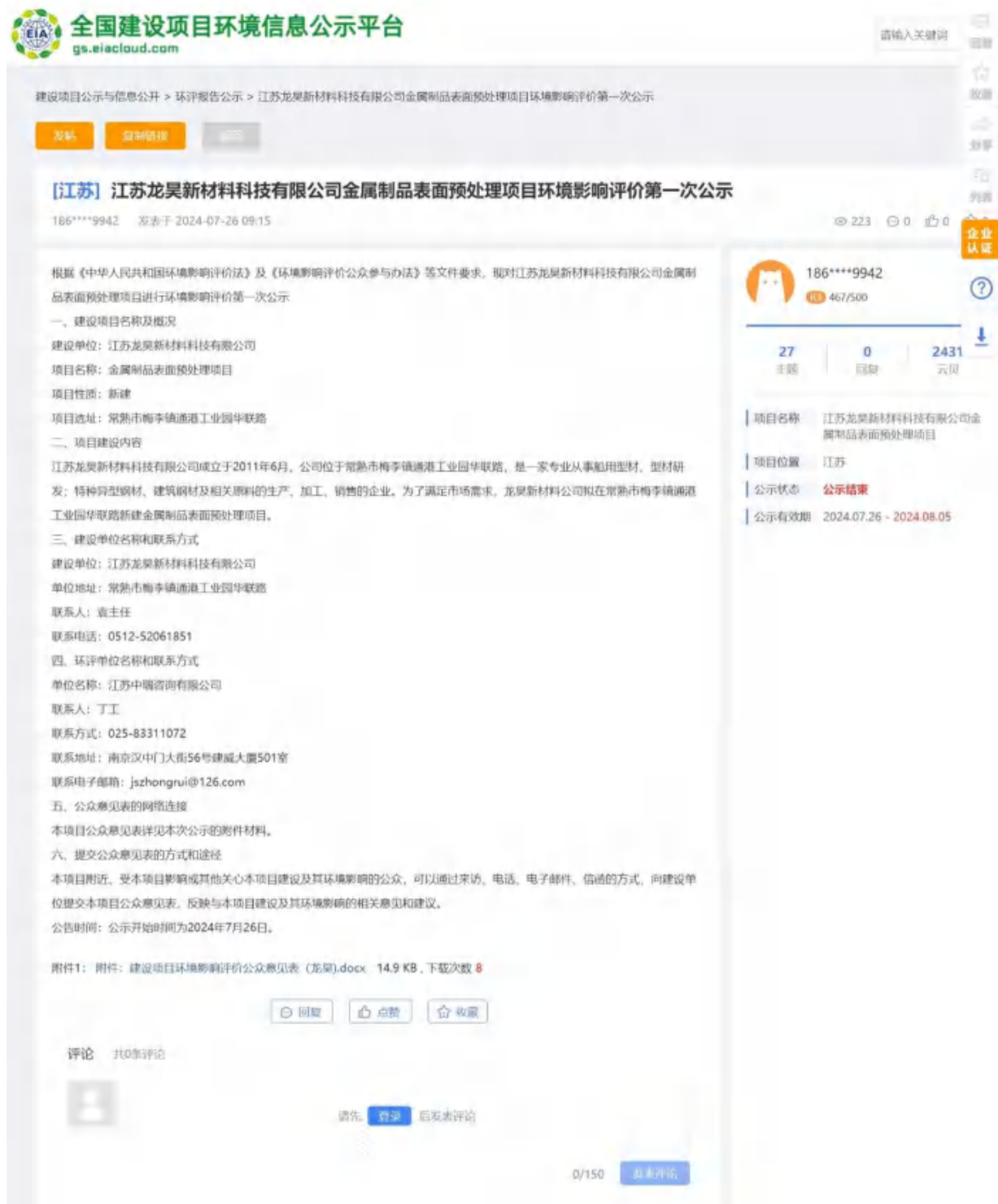
图 2-1 第一次公示截图