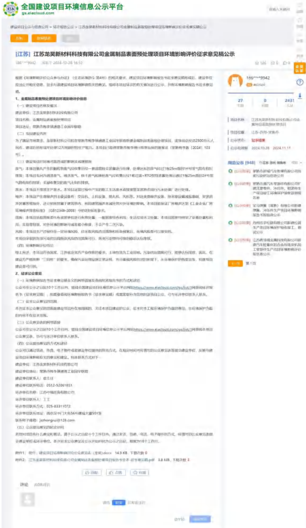
图 3-1 征求意见稿网上公示截图